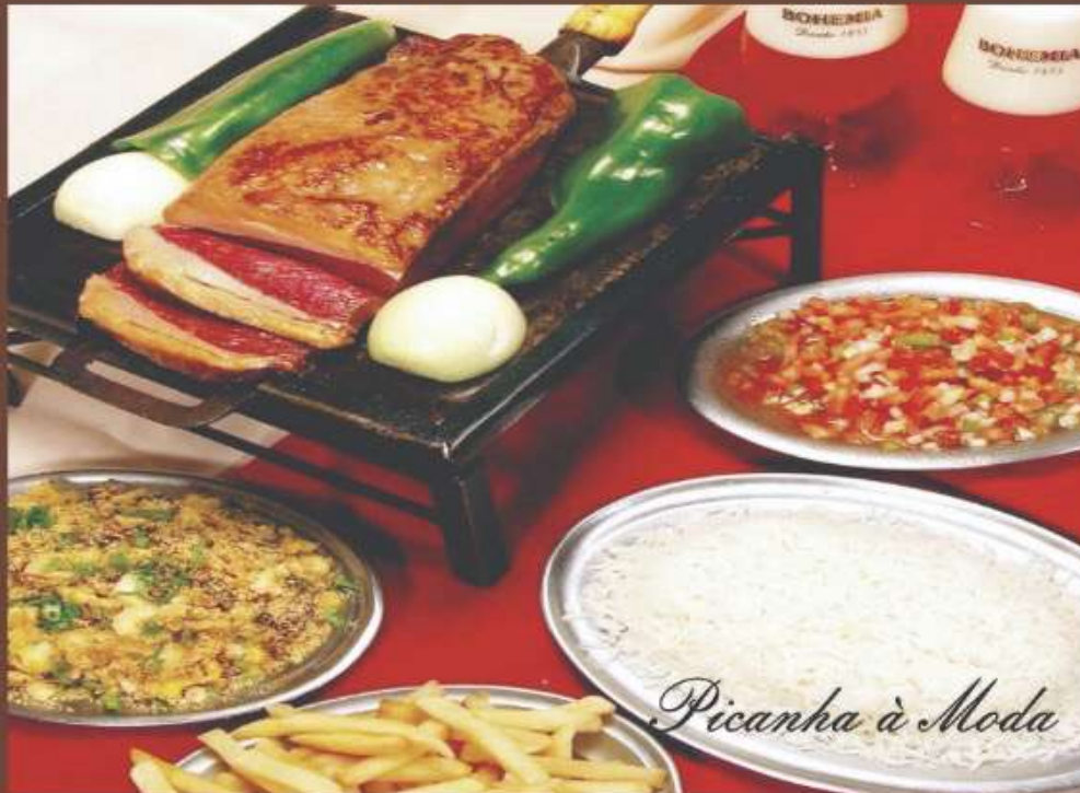
Picanha à Moda